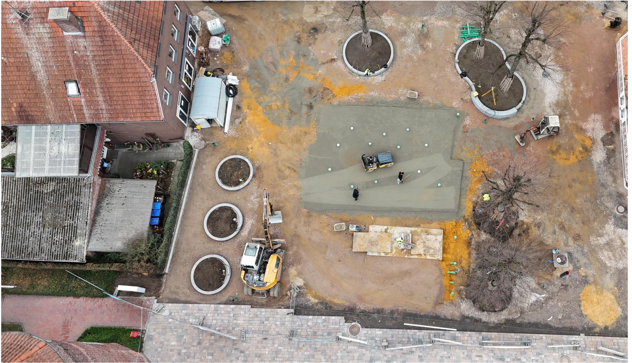
Pumpenkammer unten; darüber Fontänenfeld; links drei neue Baumstandorte mit Baumscheiben; oben Baumscheiben der Bestandsbäume