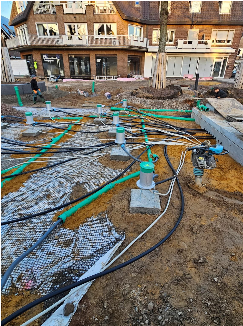
Wasser Zu- und Ablauf Düsentöpfe; Strom für Beleuchtung