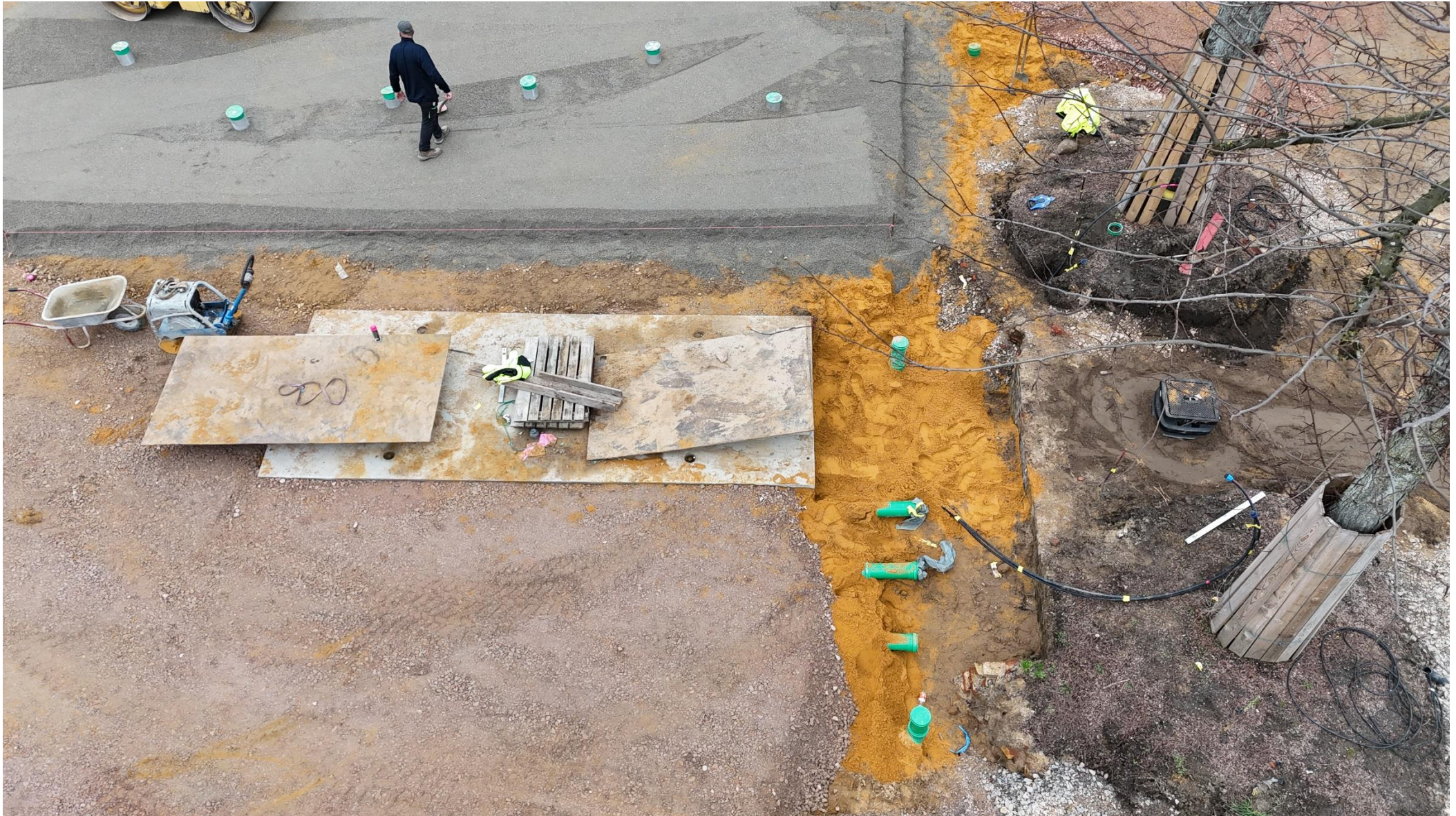
Pumpenkammer mit Verrohrung eingesandet; rechts zwischen den Bäumen Wasseranschlussschacht RWW