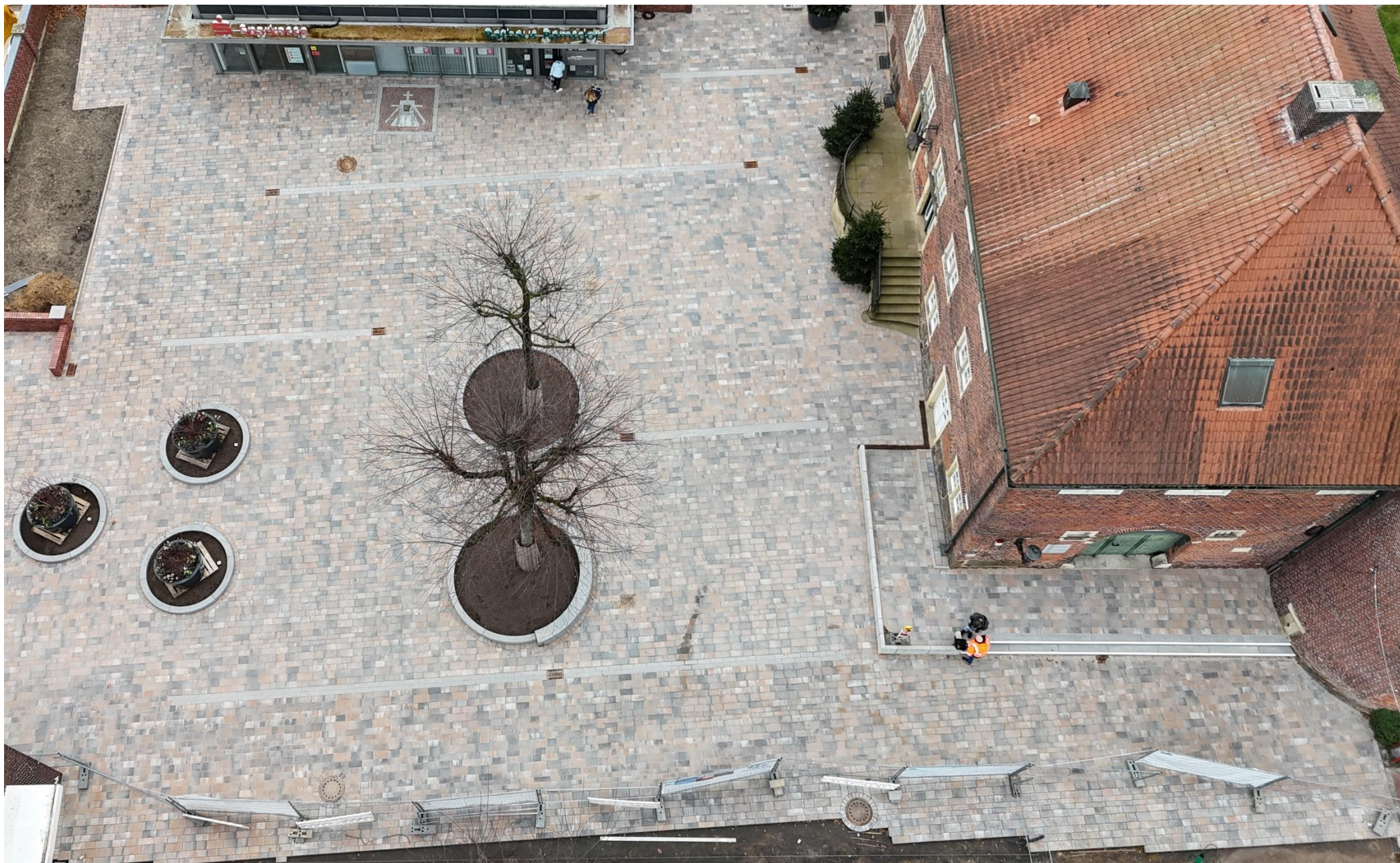
Gepflasterter Burgplatz; Stadtmobiliar (Bänke, Liegen, Sitzblöcke, Fahrradbügel), neue Bäume, Beetbepflanzung, Geländer Rampe kommen Anfang 2026